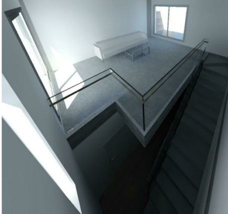
Detalle de hueco de luz planta dormitorios.

La planta Ático tiene dos grandes ventanales ( de suelo a techo ) y un cerramiento en la zona de escalera de cristal. Estos elementos hacen que la luminosidad de esta planta sea espectacular. Dicha estancia esta estudiada para que se use de despacho, estudio, gimnasio, incluso cuarto dormitorio . Todo ellos a nivel de instalaciones, tv, calefacción completa, etc. Tiene una enorme superficie de hasta 25 m 2 . Aproximadamente A través de esta gran y luminosa habitación accedemos a dos enormes terrazas con vistas espectaculares y formadas por cerramientos de cristal, ambas instaladas con puntos de luz, luminarias, agua, etc. Por sus dimensiones y geometría son muy aprovechables e independientes. Desde la terraza principal tenemos unas inmejorables vistas a Sierra Nevada y orientación sur .